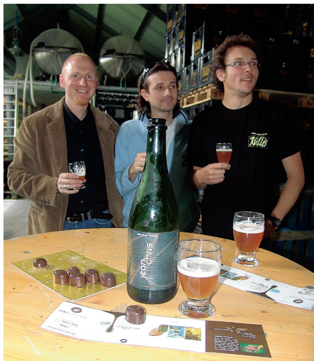
La JeanChris est l'alliance de trois artisans locaux. A découvrir avec ses pralines.

La JeanChris sera à déguster exceptionnellement aux portes ouvertes de la brasserie de La Rulles ces 7 et 8 juin. Elle est par ailleurs en vente au magasin "Mi-Orge Mi-Houblon" à Arlon ou chez Jean Le Chocolatier à Habay au prix de 4,30 € la bouteille. Des coffrets de dégustation comprenant 2 bouteilles et 2x10 pralines au prix de 14,90€ existent aussi.